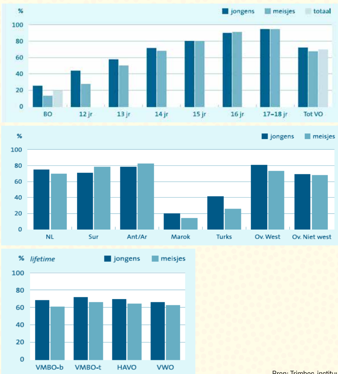
Figuur 1: Alcoholgebruik naar leeftijd, schoolniveau, geslacht en etniciteit 12 t/m 16 jaar (%)

Het Trimbos-instituut peilt sinds het midden van de jaren tachtig in hoeverre leerlingen van twaalf tot en met achttien jaar op reguliere middelbare scholen ervaring hebben met alcohol, tabak, drugs en gokken. In informatiebron 1 staan enkele overzichten gepresenteerd uit hun jaarlijkse Drug Monitor. De onderzoekspopulatie bestaat uit leerlingen van 12-16 jaar uit het voortgezet onderwijs van de eerste tot en met de vierde klas. In figuur 1 is een grafiek weergegeven die informatie geeft over hoeveel procent per leeftijd, geslacht opleidingsniveau en etniciteit ooit alcohol heeft gebruikt. BO staat voor basisonderwijs, OV.West en OV. Niet west staan respectievelijk voor overige westerse en overige niet westerse afkomst.